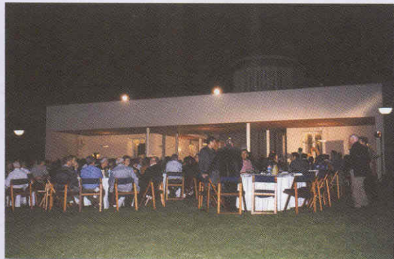
חגיגה על מדשאת בית וייצמן