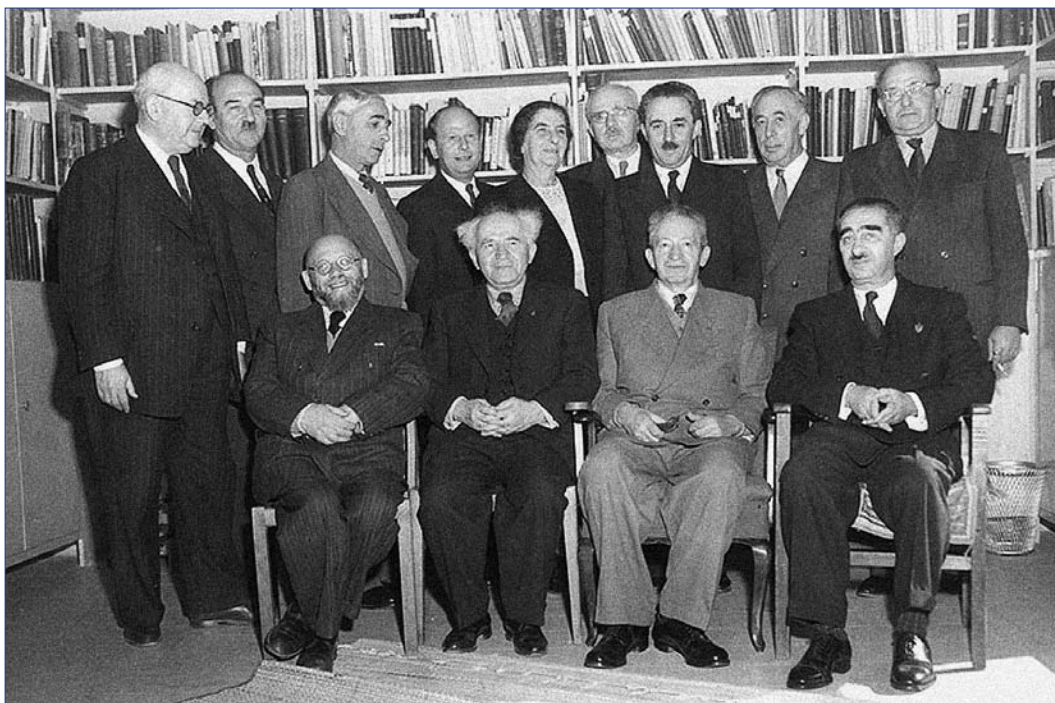
שרי הממשלה הרביעית אצל נשיא המדינה. יושבים משמאל לימין: בן-ציון דינור, דוד בן-גוריון, נשיא המדינה יצחק בן-צבי, דב יוסף. עומדים משמאל לימין: פרץ נפתלי, לוי אשכול, פנחס לבון, יוסף סרליו, גולדה מאיר, פנחס רוזן, משה שרת, ישראל רוקח, פרץ (פריץ) ברנשטיין, 25.12.1942

◀ לא בכדי מעוררים ההישגים הללו השתאות גדולה, אך עדיין ארוכה הדרך אל העצמה הרוחנית המיוחלת, ורבים האתגרים הניצבים לפנינו בכל תחומי החיים והעשייה. בדרך אל התיקון החברתי הנדרש בדחיפות חייבים לשמש נר לרגלנו מצוות ועקרונות יסוד ממורשתנו הקדומה, מהם השגורים בפינו כמו "כל אדם נברא בצלם אלהים", "מה ששנוא עליך אל תעשה לחברך" או "ואהבת לרעך כמוך", ומהם נדירים יותר, למשל: "כאזרח מכם יהיה לכם הגר אתכם