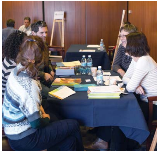
מרכז הקשר, כחלק מפעילותו, ארגן השנה, זו הפעם החמישית, מפגש ויריד תעסוקה שנתי, שבו הגופים השונים המעורבים בהשבת מדענים לישראל מציגים את פעילויותיהם, ומתקיימות שיחות בין מדענים השוקלים לחזור ארצה לבין נציגי המוסדות האקדמיים ועם מדענים שכבר חזרו ומספרים מניסיונם. כדי להגיע לחוקרים רבים, ככל האפשר, ברחבי העולם שודרו ההרצאות והפאנלים בשידור חי בערוץ ה"יוטיוב" של האקדמיה.

בחידושים באתר יהיה לוח מודעות אינטראקטיבי שירכז את כל המשרות האקדמיות בישראל, הן באוניברסיטאות הן במכללות האקדמיות הן במכוני המחקר השונים, כדי שהרשומים במאגר יוכלו לחפש משרות בצורה אפקטיבית. למעשה, זאת תהיה הפעם הראשונה, בעקבות שיתוף