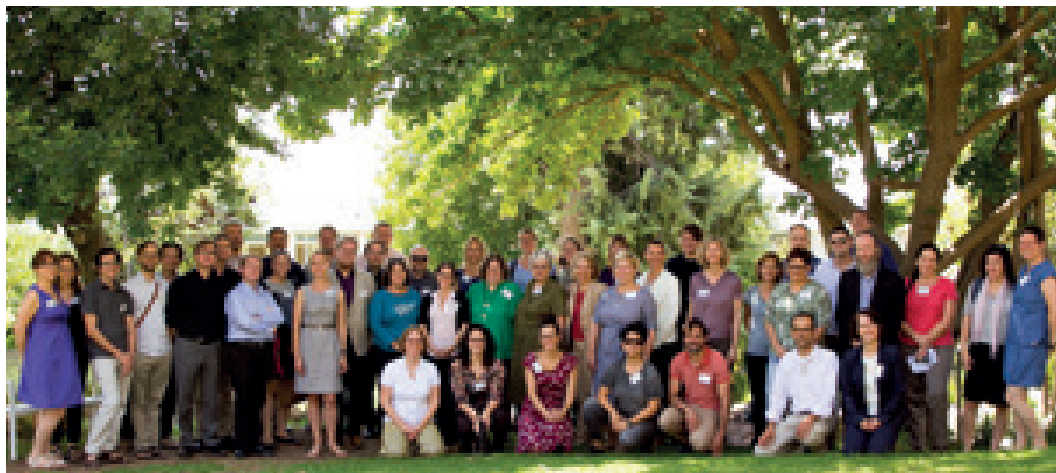
משתתפי כינוס GISFOH 2017, בקיבוץ מעלה החמישה

הסכם שנחתם בשנת 2009 בין האקדמיה לקרן אלכסנדר פון הומבולדט הגרמנית הוביל לכינון סדרת כינוסים דו־לאומיים רב־תחומיים במדעי הרוח, שבהם משתתפים כחמישים חוקרים צעירים – ישראלים וגרמנים. בכל שנה נבחרים ארבעה חוקרים ישראלים וארבעה חוקרים גרמנים מארבעה תחומים שונים במדעי הרוח והחברה, ויחד הם מרכיבים את הוועדה המארגנת של הכינוס. הכינוס מתקיים בישראל ובגרמניה לסירוגין. מטרת הכינוס הן להפגיש חוקרים צעירים מצטיינים מתחומים שונים ולאתגר אותם לחשיבה ולמחקר מעבר לגבולות תחום הדעת שלהם, לאפשר הפריה הדדית וליצור ערוץ לחילופי ידע אקדמי.