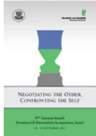
עטיפת חוברת הכינוס