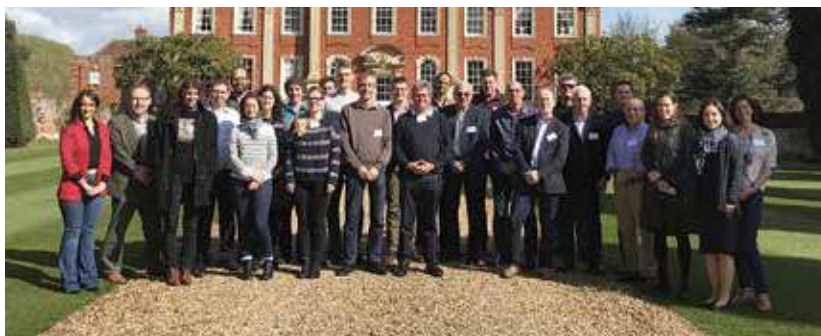
משתתפים בסדנה המשותפת לאקדמיה ולחברה המלכותית הבריטית בנושא טיפול במים