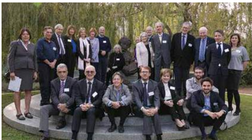
משתתפים בכינוס "מדע ללא גבולות" שנערך בשיתוף האקדמיה הצרפתית למדעים