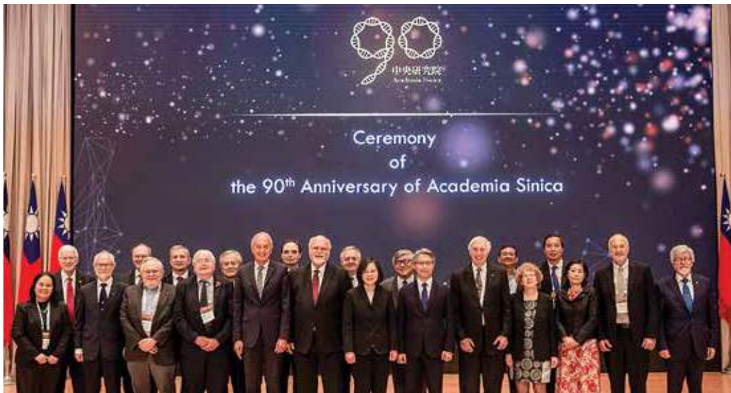
המשתתפים בכינוס "הפורום הבין-לאומי של מנהיגי מדע" לציון 90 שנים לייסודה של האקדמיה סיניקה