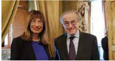
פרופ' אלברטו קוואדריו קורציו ונשיאת האקדמיה פרופ' נילי כהן בכינוס Science and Society ברומא

ההסכם לשיתוף פעולה מדעי עם האקדמיה הלאומית האיטלקית דיי לינצ'יי נחתם בשנת 2000.