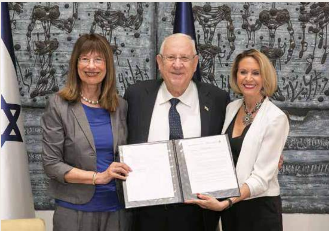
מימין: נשיאת האקדמיה הלאומית למדעים של ארצות הברית ד"ר מרשה מק'נאט, נשיא המדינה מר ראובן (רובי) ריבלין ונשיאת האקדמיה פרופ' נילי כהן במעמד חתימת ההסכם בין האקדמיות

בשנים האחרונות נחתמו הסכמים עם החברה המלכותית הבריטית (Royal Society), עם אזרבייג'ן, עם ליטא ועם צ'כיה. השנה נחתם הסכם היסטורי לשיתוף פעולה עם האקדמיה הלאומית למדעים של ארצות הברית (National Academy of Sciences – NAS).