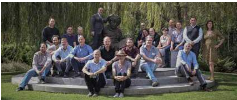
משתתפי הסדנה המשותפת ישראל-אזרבייג'ן בנושא ססמולוגיה של רעידות אדמה וגאודינימיקה