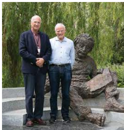
מימין: פרופ' לירוי הוד וסגן נשיאת האקדמיה פרופ' דוד הראל בכינוס בנושא מדעי המחשב בשיתוף האקדמיה הלאומית למדעים של ארצות הברית.