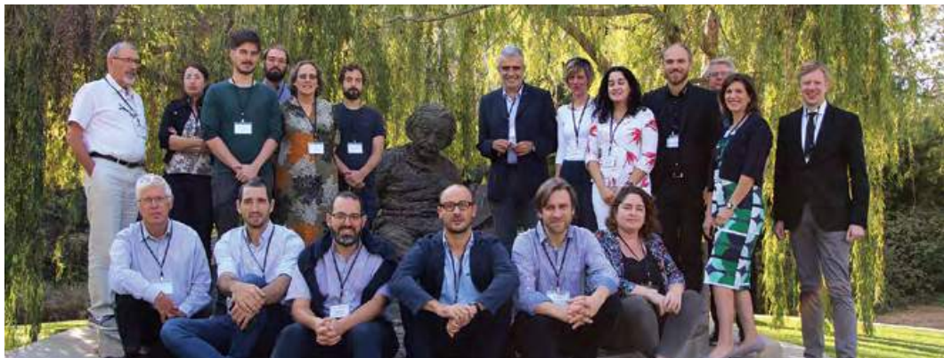
משתתפים בכינוס בנושא ארכאולוגיה חישובית שנערך בשיתוף האקדמיה הלאומית הגרמנית למדעים - לאופולדינה