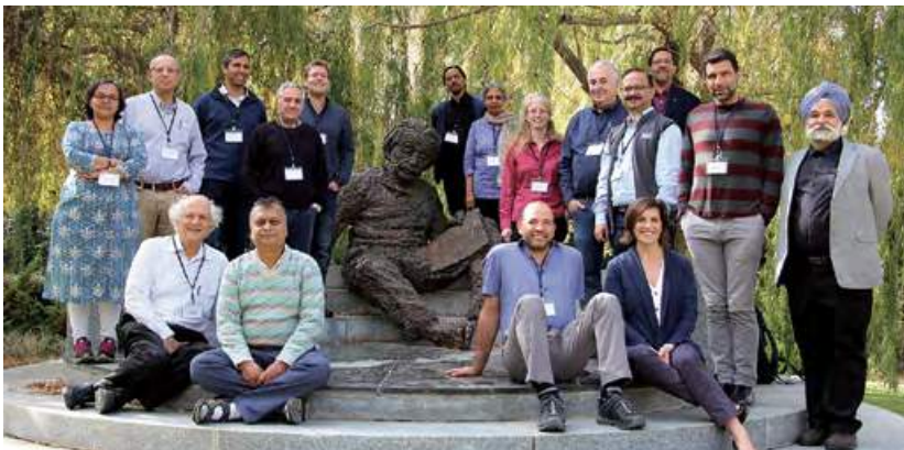
משתתפים בסדנה Astrophysics and Planetary Science שנערכה בשיתוף האקדמיה הלאומית ההודית למדעים